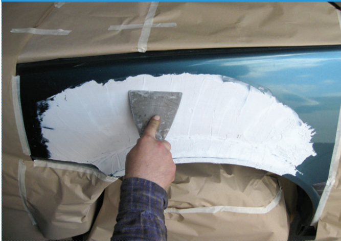
Fase | Step 1

Esempio di riprofilatura della modanatura originale | Example of reprofiling of original mouldings