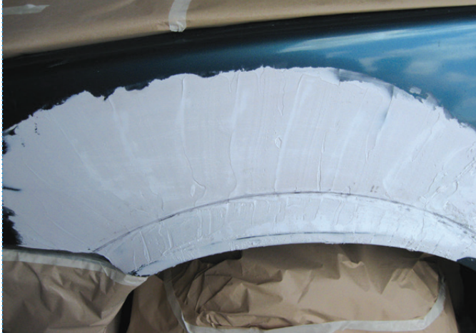
Fase | Step 3

La zona da levigare e profilare è chiaramente e velocemente segnata Working area is clearly and quickly indicated by a secure pencil sign