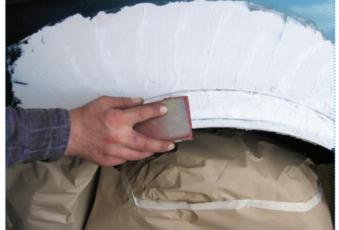
Fase | Step 4

Levigatura e riprofilatura del lamierato Grinding and reprofiling of panel sheet