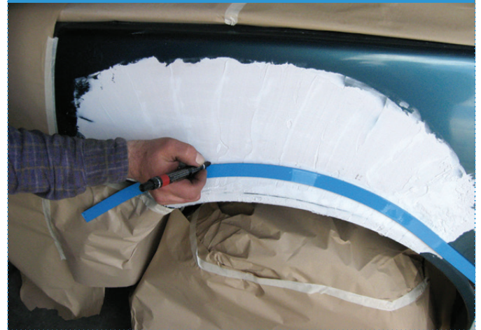
Fase | Step 2

Applicare la striscia magnetica seguendo il profilo originale e tracciare un linea di lavoro con la matita Apply magnetic strip along the original profile and sign a working line by pencil